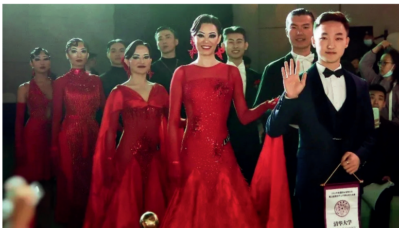
中国国际标准舞总会“院校杯”对抗赛上的清华大学代表队