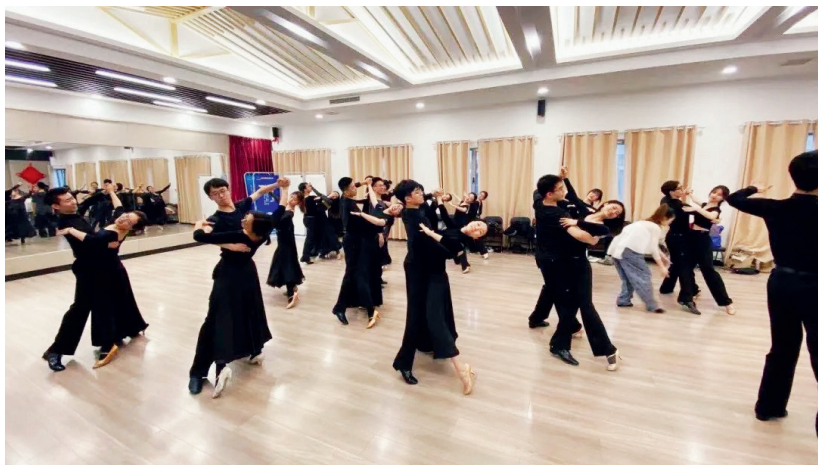
国标队的日常训练

对于参加院校杯的队员们来说，代表学校出战意味着这是一次需要认真对待的对抗赛，可是从舞蹈交流的层面来说这更多是一场友谊赛。比赛设计了一个特殊的环节，在公布成绩前，大家要邀请其他学校的舞者一起在舞池中共舞，共同探讨、共同进步，队员们纷纷表示“这是一个十分愉悦、酣畅淋漓的交流的过程”。