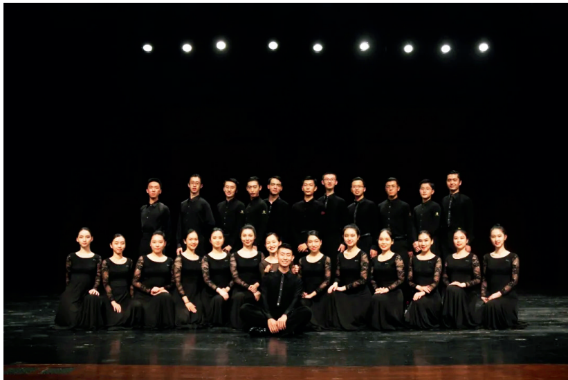
清华大学学生艺术团国标队

在这里发现自己不一样的侧面， 在这里找到辛苦浇灌出来的幸福， 在这里确定人生的又一重价值—— 回望来路，遇见国标舞： 无论是心心念念、一往无前， 还是机缘巧合、惊鸿一瞥 在旋转挪移中慢慢确定心之所向， 这是一群人和一支舞的故事。