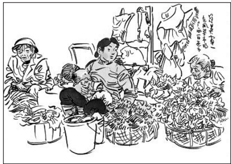
东风菜市场 吴冠英 / 绘

二十多天里，我们穿行于罗马、佛罗伦萨、卢卡、比萨、锡耶纳、威尼斯、西西里、摩纳哥、阿维尼翁、阿尔、马赛……见缝插针地画了三十多幅速写。回