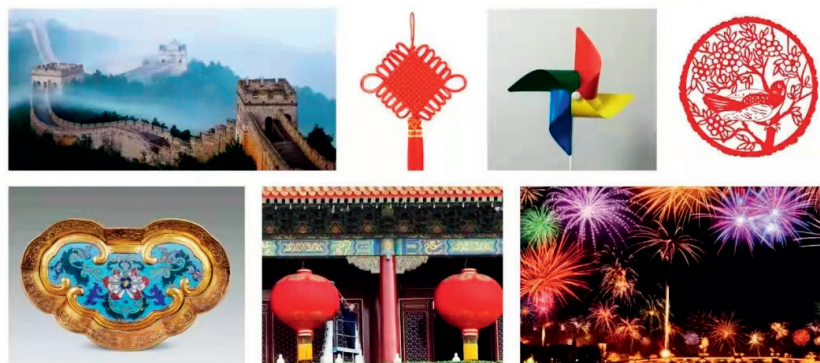
中国文化元素——长城、中国结、风车、窗花、如意、灯笼、烟花