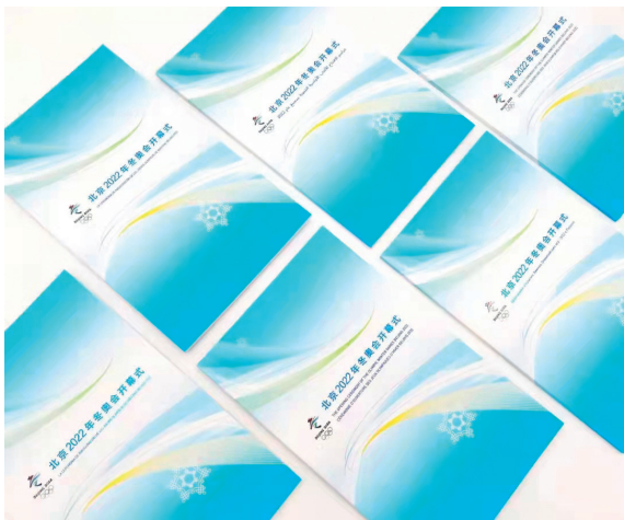
《北京 2022 年冬奥会开幕式》手册 VIP 六国语言版