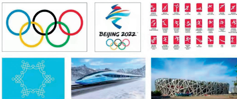
冬奥会元素——奥运五环、冬奥 logo、冬奥项目图标、核心雪花图形、京张高铁、鸟巢