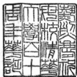
热烈庆祝母校清华大学百十周年华诞

新时代，振兴期，新高度，新格局。 再出发，奋力中华崛起。为科技 创新探路，为民族振兴砥砺。立宏 图，任重而道远，齐努力！