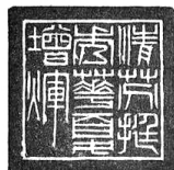
清芬挺秀 华夏增辉