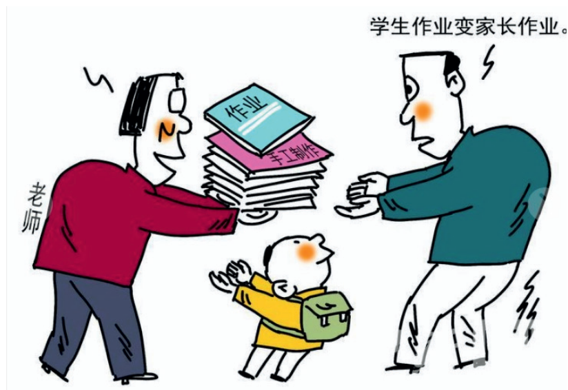
数以亿计中小學生捧着同一標準答案死記硬背，刷題補課皓首窮經十幾年，既浪費生命，又遏制創造力。

在推出 ChatGPT 一周年之际，召开开发者大会。CEO 山姆·阿尔特曼发布了 GPT-4 Turbo 新进展。一是大模型知识库再度扩容，囊括人类 2023 年 4 月之前的优质知识；二是除了语言，还可以通过文字、图片、视频等多模态方式与大模型交流；三是用户提问的容量可以大到 128k，或者说一次可以问十万字的问题；四是可在大模型生态中借助平台功能分身套壳，二次开发自己的 APP，用作私人助理或售卖；五是内存存储 AP 不仅有记忆功能，而且没有智能化版权保护机制，为用户提供依法索赔及费用支付保护；六是大幅降价，足以轻松进入寻常百姓家，造福全人类。