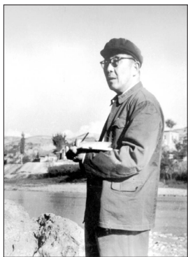
生进行野外实地考察 ——一九七八年，王大纯先

王大纯，1915年10月19日出生于河北省丰润县。1929年9月考入天津南开中学。面对日本帝国主义侵占我国东北、覬觐华北，而国民党政府对日不断地妥协让步，他在中共地下党员张锋伯和吴宽两位教师的组织下，加入南开中学青年会社，号召天津的青年学生与市民反对《中日塘沽协定》，反对《何梅协定》，提出“反蒋抗日”的口号。