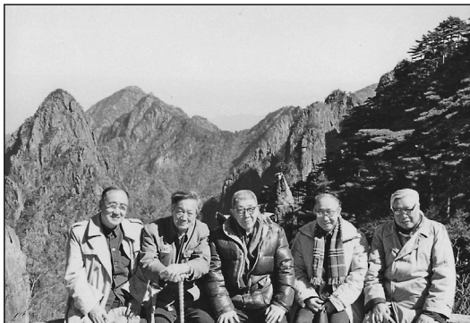
1988年10月，王大纯先生（中）与闫锡屿先生（右1）、贾福海先生（右2）、陈梦熊先生（左2）等水文地质界老友相聚黄山

王大纯在20世纪60年代初提出并确立了中国地下水的分类与成因理论。在20世纪70年代初，他明确提出了充分保护、合理开采地下水资源的理念，并提出了以地球系统科学的概念研究地下水这一前瞻性论断。这些理论、概念和论断在当今得到了普遍认同与实际应用。