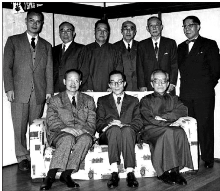
梅贻琦校长与史前期清华校友在一起。前排右起：胡适、梅贻琦、赵元任，后排右起：浦薛凤、杨锡仁、周象贤、李鸣合、陈伯庄、程远帆