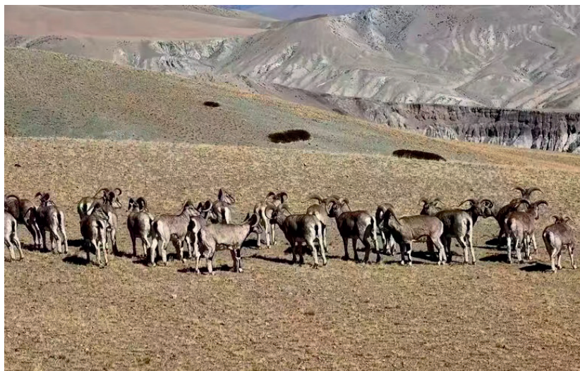
札达县的野生动物