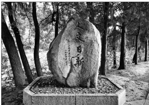
1934级校友毕业60周年赠石

闻名世界的国学大师王国维、梁启超、陈寅恪、赵元任，虽称“国学大师”，但无一不是留洋学者，都精通外